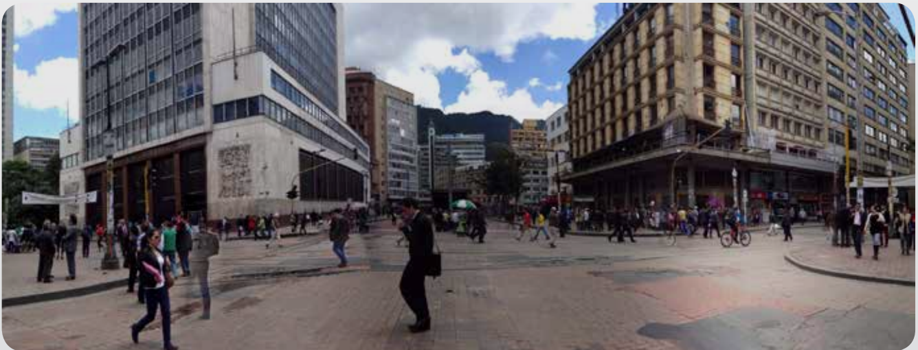
Figura 6. Vista de Eje Ambiental a la altura de la carrera séptima.

26 de Febrero 2014