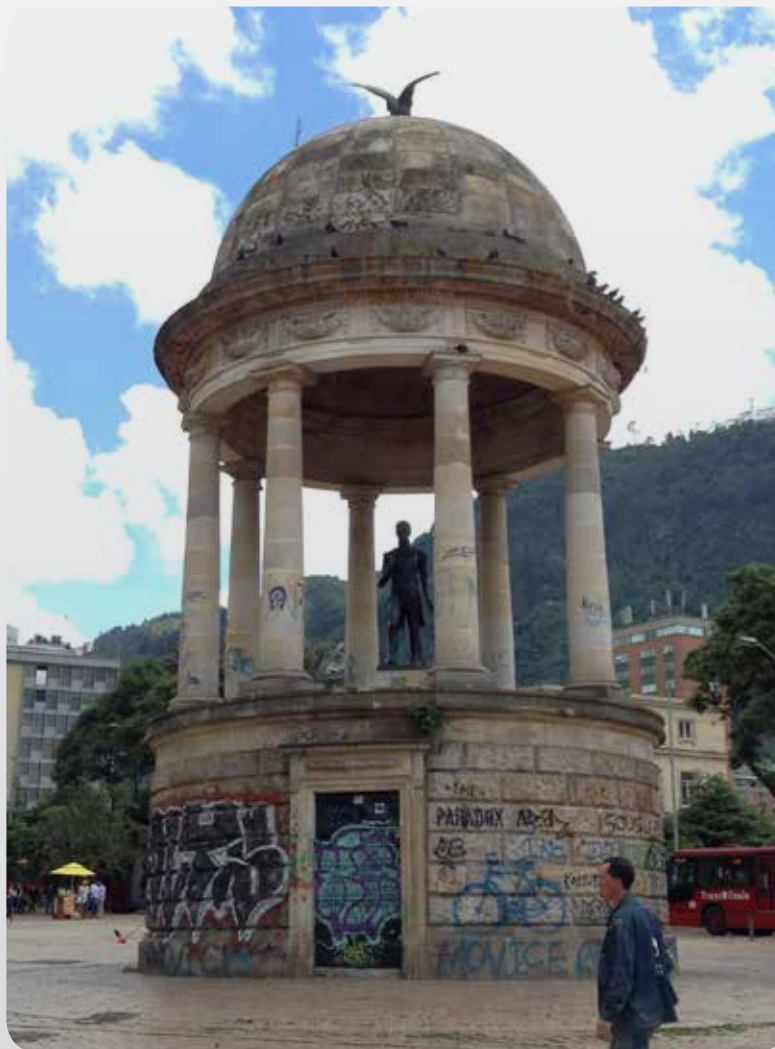
Figura 4. Estado del monumento a Simón Bolívar en El Parque de los Periodistas.

Fuente: Fotografía por Gómez y Moyano, 26 de Febrero de 2014