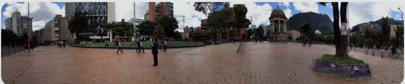
Figura 5. Vista del Parque los Periodistas, Avenida Jiménez con carrera tercera.

26 de Febrero de 2014