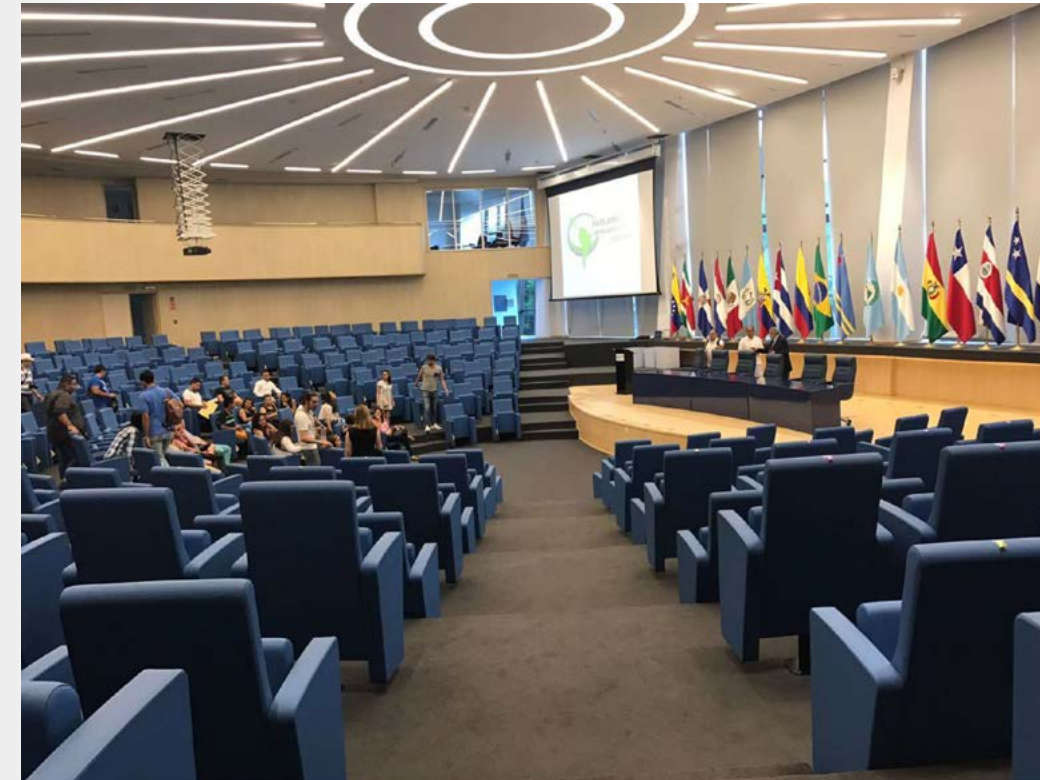
Imagen No. 35 – Auditorio principal del Parlamento Latinoamericano y del Caribe.