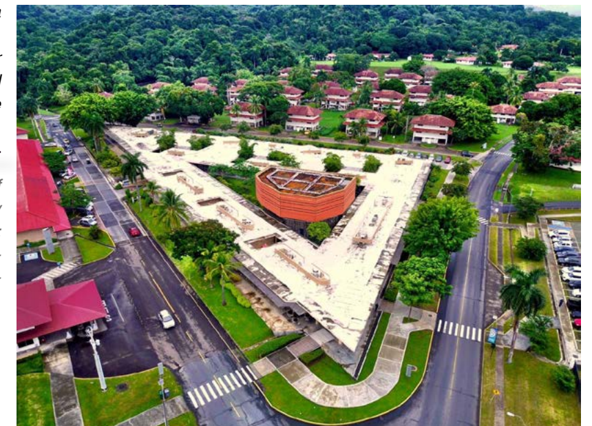
Image No. 35 – Aerial view of La Plaza Ciudad del Saber [City of Knowledge Plaza]. Source: Photo by François Poncet, student of the Architecture Program (June 23, 2017).