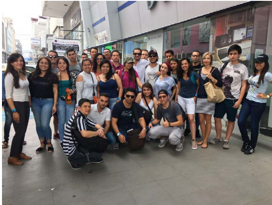
Imagen No. 25 – Participantes del XXV Taller Internacional Interdisciplinario Panamá en la visita al Mercado del Marisco. Fuente: Archivo fotográfico Departamento de Relaciones Internacionales (17 de junio de 2017).