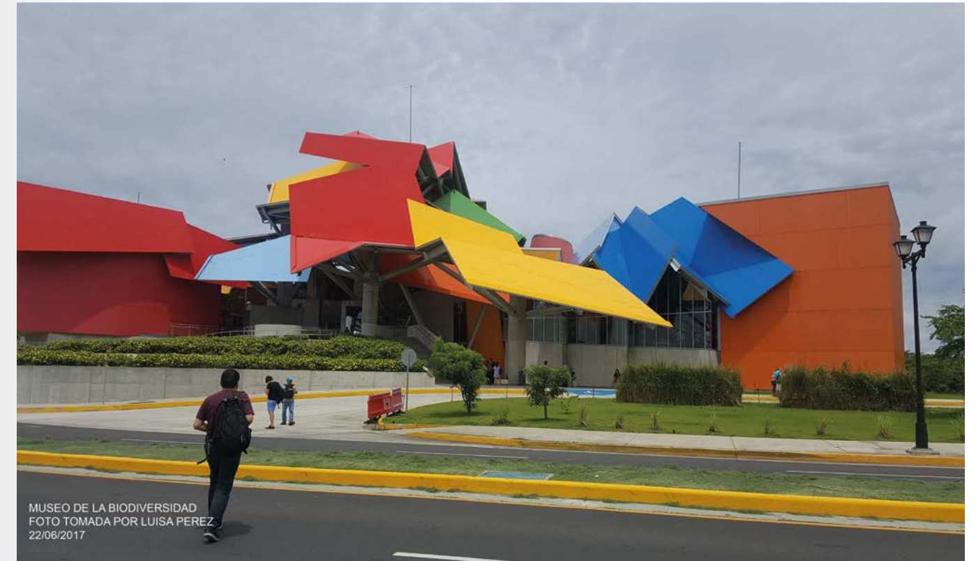
Imagen No. 39 – Museo de la Biodiversidad - Ciudad de Panamá.