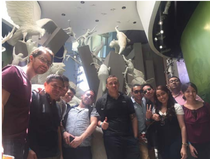
Imagen No. 33 – Participantes del XXV Taller Internacional Interdisciplinario Panamá durante la visita al Biomuseo.