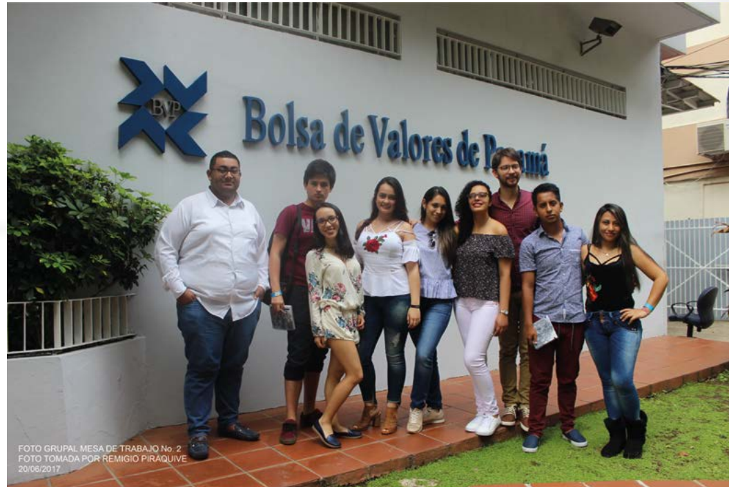
Image No. 37 – Student participants in the 25th International Interdisciplinary Workshop – Panama during their visit to the Panama Stock Exchange. Source: Photo by Remigio Piraquive, student of the Economics Program (June 20, 2017).