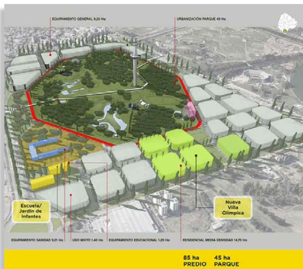
Imagen No. 69 – Pie de foto: Ilustración del predio correspondiente al complejo olímpico en Villa Soldati, Buenos Aires, Argentina.