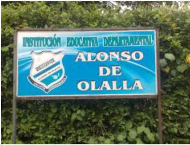
Imagen 7. Colegio Departamental Alonso De Olalla (entrada).