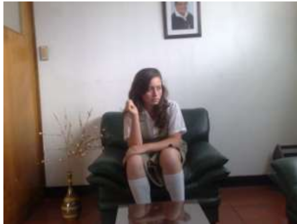
Imagen 3. Colegio Madre del Divino Pastor (entrevistada).