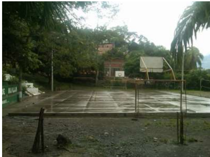
Imagen 6. Colegio Departamental Alonso De Olalla (zona deportiva).