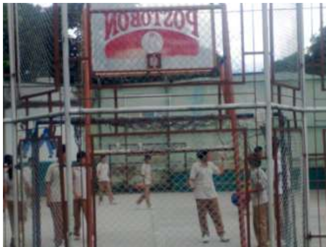
Imagen 4. Colegio Madre del Divino Pastor (zona deportiva).