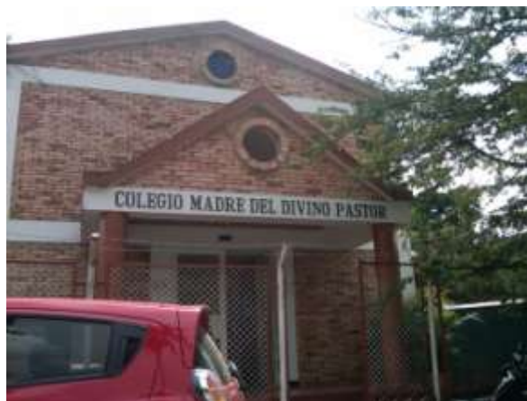
Imagen 1. Colegio Madre del Divino Pastor (entrada).