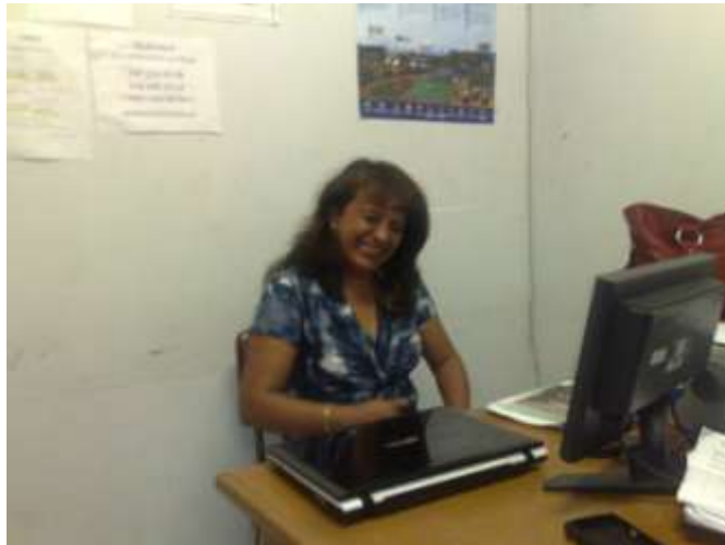
Imagen 8. Colegio Departamental Alonso De Olalla (entrevistada).