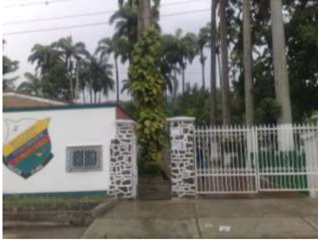
Imagen 5. Colegio Departamental Alonso De Olalla (entrada).