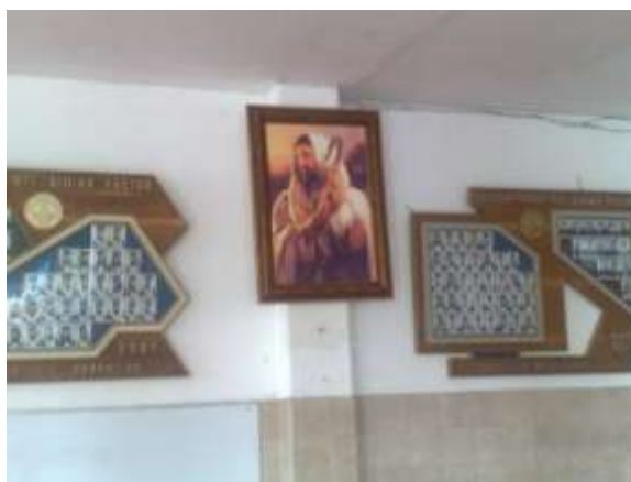
Imagen 2. Colegio Madre del Divino Pastor (secretaria).