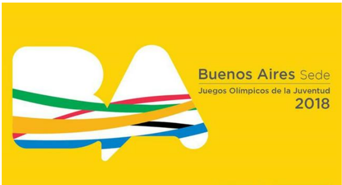
Fotografía 4 (imagen promocional juegos olímpicos de la juventud 2018) tomada página promocional del gobierno Argentino (agosto 2016) Fuente (GOBIERNO REPUBLICA ARGENTINA, 2015)

Después de realizada la segunda ronda de votación quedo elegida la ciudad de Buenos Aires un gran logro para el país y para todo el continente Americano, este evento siempre fue llevado a cabo durante el mes de Agosto pero por estar ubicado en la parte sur del continente para este mes se encuentran en invierno por tal motivo fue movido para el mes de Octubre así mismo fue llamado, “III Juegos Olímpicos de la Juventud de Verano”.