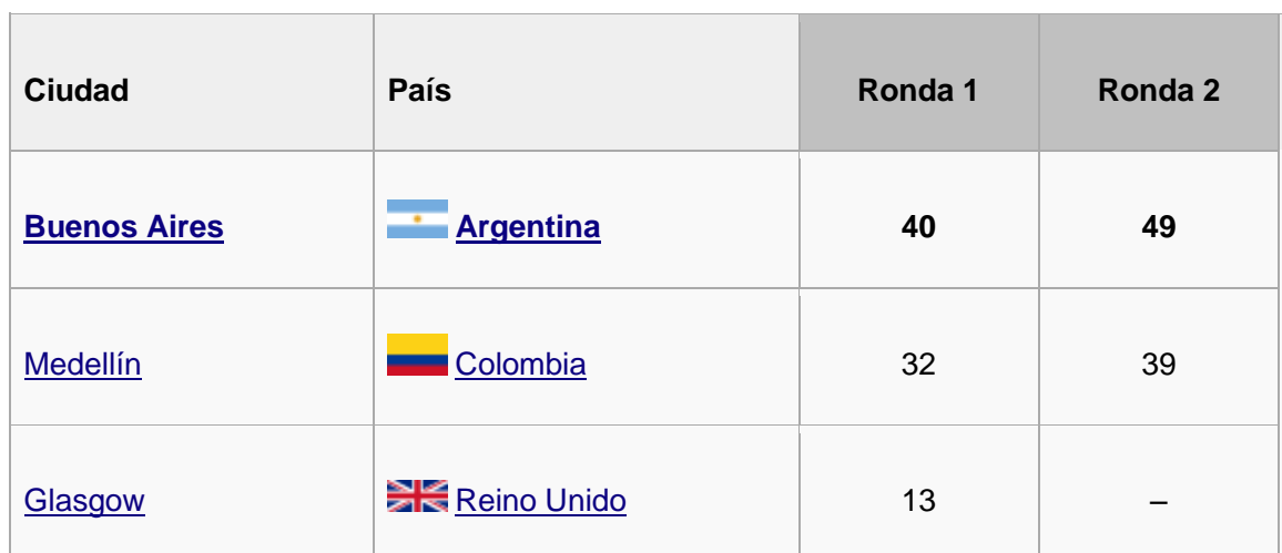
Tabla 1 (finalistas elección de sede para los III juegos olímpicos de la juventud 2018) (GOBIERNO REPUBLICA ARGENTINA, 2015)

Desde el 2011 La Argentina mostro su interés por realizar esta gran evento pero solo hasta el 2012 se pudo realizar oficialmente su postulación debido que en ese entonces logró cumplir con todo lo requerido por el Comité Olímpico Internacional. En el mes de febrero del 2013 este comité dio a conocer las ciudades finalistas que podrían realizar este evento “(Buenos Aires, Medellín, Glasgow, Guadalajara y Rotterdam) después de realizar distintas votaciones quedaron tan solo 3 ciudades de las cuales 2 eran de sur América algo maravilloso ya que sería la primera vez que un evento de tan alta importancia se realizaría en este continente.” (GOBIERNO REPUBLICA ARGENTINA, 2015)