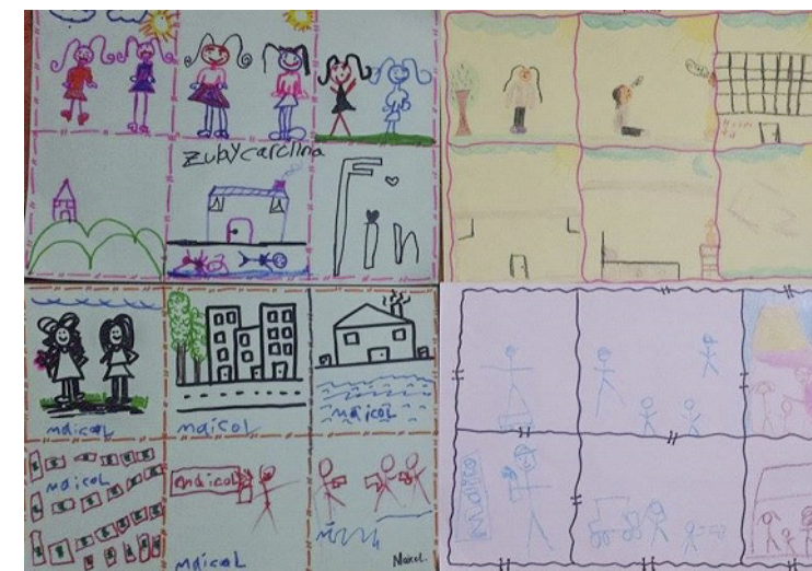
Figura 3. Historietas realizadas por los niños. Planteadas desde una historia creada por ellos mismos donde reflejaban aspectos de su contexto de vida