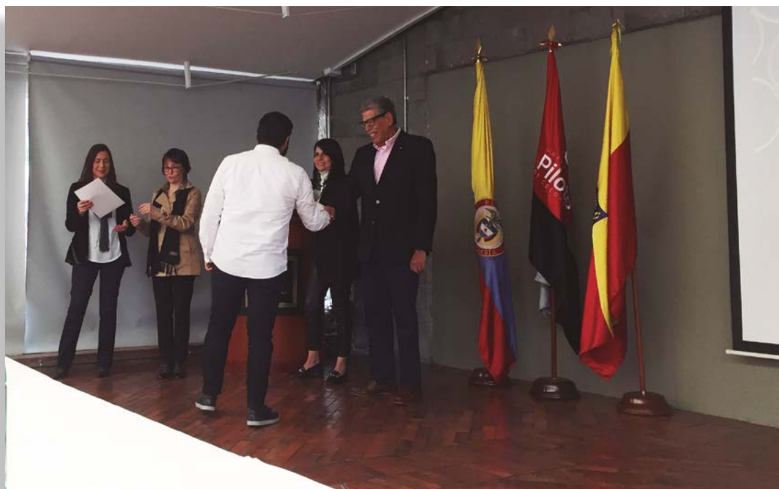
Fotografía 8. Entrega de diplomas de participación por parte de los directivos tanto a estudiantes como docentes participantes en el Taller Internacional.

de los directivos a los estudiantes y a los docentes participantes del XXVII Taller Internacional Interdisciplinario.