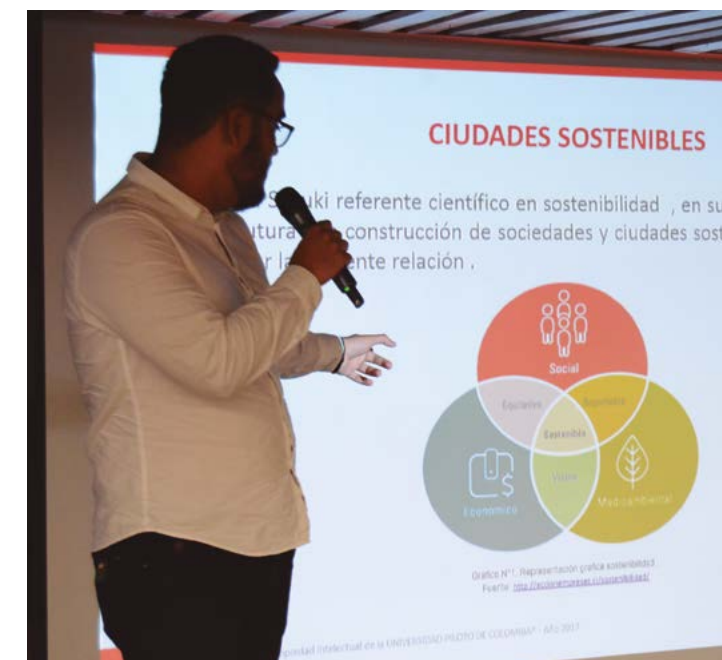
Fotografía 2. Presentación de las propuestas elaboradas por los estudiantes en la primera evaluación en la fase inicial en Bogotá.

Al finalizar la semana, se realizó la primera evaluación. En ella, los estudiantes expusieron durante 15 minutos la totalidad del proyecto hasta el diagnóstico y una primera aproximación a las estrategias de intervención. Los estudiantes realizaron esta exposición argumentando conceptualmente la propuesta.