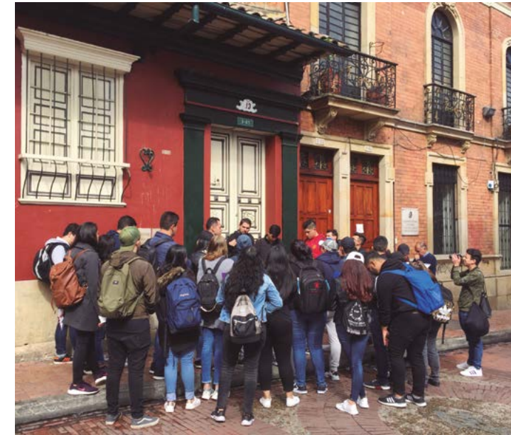
Fotografía 1. Recorrido casa del poeta José Asunción Silva, jornada de la mañana.

En la segunda semana se realizó la salida académica por el centro histórico de Bogotá para soportar el diagnóstico y el análisis del sitio de intervención de los proyectos propuestos por los estudiantes desde los retos de las mesas de trabajo. El recorrido fue guiado por los docentes de la Cátedra Bogotá y los docentes de apoyo al Taller. Allí se presentó una contextualización histórica y de las transformaciones desde el Chorro de Quevedo hasta la Plaza de Bolívar. Se transitó por la casa de Poesía Silva, la iglesia de la Candelaria, la manzana cultural del Banco de la República, el Centro Cultural Gabriel García Márquez, la plaza de Bolívar; se finalizó en la Casa de José Rufino Cuervo.