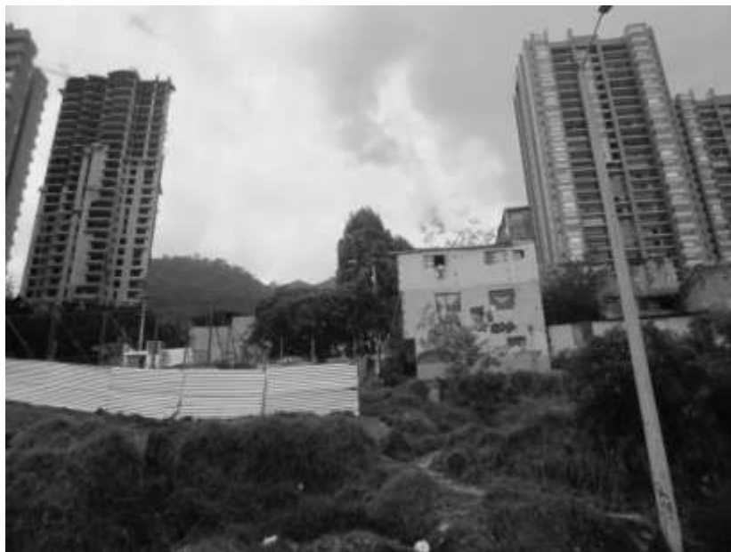
Figura 3. Imagen Barrió Los Olivos tomada desde la carrera 1 con calle 63

A continuación se observa otra imagen fotográfica en la que se muestra de manera evidente lo que sucede alrededor del barrio con el proceso de invisibilización que se está tiendo por parte de las urbanizaciones de edificios con mejor estratificación.