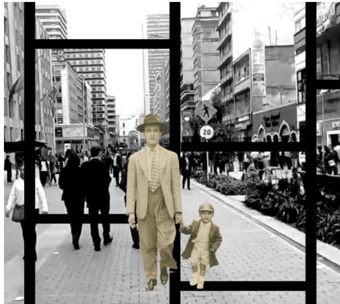
Imagen 1: la subordinación de lo moderno a lo histórico

arquitectura obrera frente a la arquitectura burguesa sino se enfrenta a un problema mayor, un problema de la globalización. Esta corriente de Rossi entretiene la conservación como punto primordial y en entendimiento y conservación de la estructura arquitectónica como elemento determinante para el entendimiento de la ciudad, por ende, también aplicable al espacio público, sin embargo que hacer cuando este pensamiento ya no se enmarca en ciudades milenarias como las europeas si no lo llevamos a una ciudad latinoamericana o directamente a Bogotá, donde se han vivido grandes transformaciones y mutaciones a travez del tiempo y esa concreta visión culturalista puede quedarse corta y solo aplicable a una pequeña porción de ciudad pues gran parte de esta ha surgido espontáneamente o mas bien su historia no supera los 200 años comparada con ciudades italianas o francesas como París que tiene una datación como ciudad de mas de dos mil años.