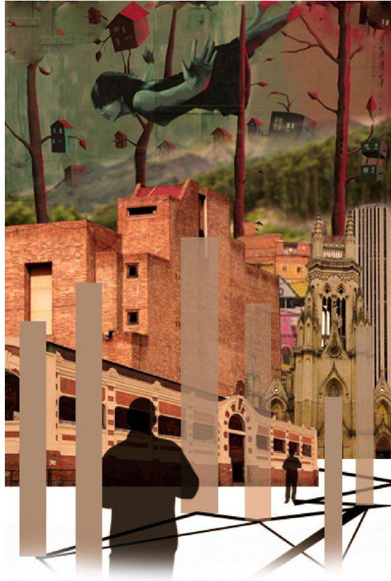
Imagen 2: diversidad y evolución de la ciudad.

Es momento de mencionar el interés por la experiencia que comienza a tener el entendimiento de la ciudad y el espacio, pues gran parte del aporte teórico a este proyecto viene de fuentes encaminadas al cuestionamiento de la vivencia de la arquitectura y el espacio en general, de preguntas menos enfocadas en el funcionalismo pragmático y más proyectadas a entender lo que ocurre debajo de la piel cuando nos enfrentamos al entorno, preguntas por ejemplo ¿Cómo se siente esto o aquello?, ¿Qué me transmite esto?, son sin duda el objetivo de quien busca impactar en la sensibilidad del vivir en espacios, un gran ejemplo es Peter Zumthor, (2006) cuyos escritos son de gran importancia en la validación de este proyecto. En una de sus obras más celebres en términos de sensibilidad emocional ese hecho de priorizar la percepción en los espacios, descritas de forma muy clara y contundente en su libro “Atmósferas” esa impresión que lleva al ser humano a conectarse o no con ciertos momentos y situaciones, al hablar en esos términos realmente no se refiere a un concepto utópico desligado de objetividad, es más bien lo más cercano a la persona, lo más real que puede ser la arquitectura para alguien, el momento que logra conectar, en términos vulgares, el ladrillo con el corazón.