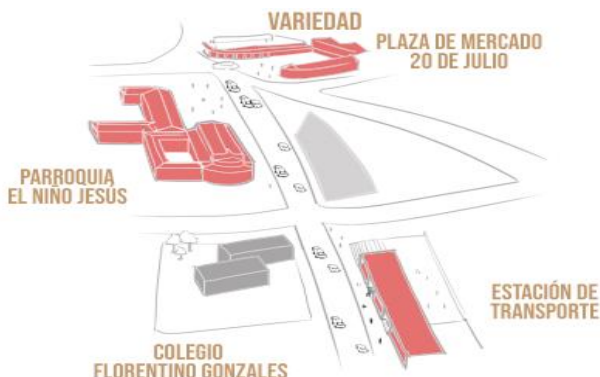
La Ilustración 4. Representación urbana barrio 20 de julio – elaboración propia desde el

El barrio 20 de Julio, se ha caracterizado por un desarrollo histórico desarrollado entorno a sus centros de comercio y al centro religioso principal de la zona, no es una excepción que el barrio crece a partir de su plaza y con el paso de los años se articula con el crecimiento de la ciudad proyectado a lo largo de sus vías principales.