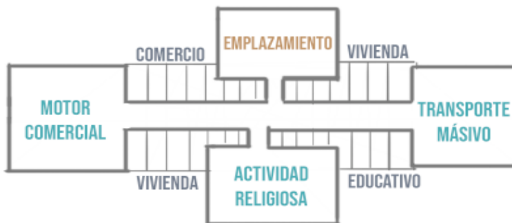
Ilustración 5. Esquema de compacidad urbana – elaboración propia

terminal de transporte hasta el motor comercial, se traza un eje compuesto de elementos de comercio, vivienda, dotacionales educativos y religiosos, el proyecto se emplaza a lo largo de esta carrera y significa un espacio de alto flujo peatonal con dinámicas sociales y culturales que a través de la operación de integrar el interior con el exterior, por medio de elementos análogos de la ciudad, puede contribuir a la activación, uso y apropiación del proyecto cultural y de su contexto.