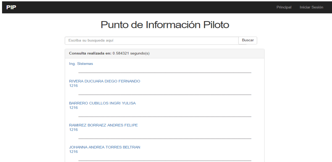
Ilustración 2: Consulta sin Login - Consultor PIP

En este tipo de consultas se tiene en cuenta al usuario como un invitado en donde única y exclusivamente puede visualizar información de la universidad que se denomine publica o se tenga sincronizada como tal.