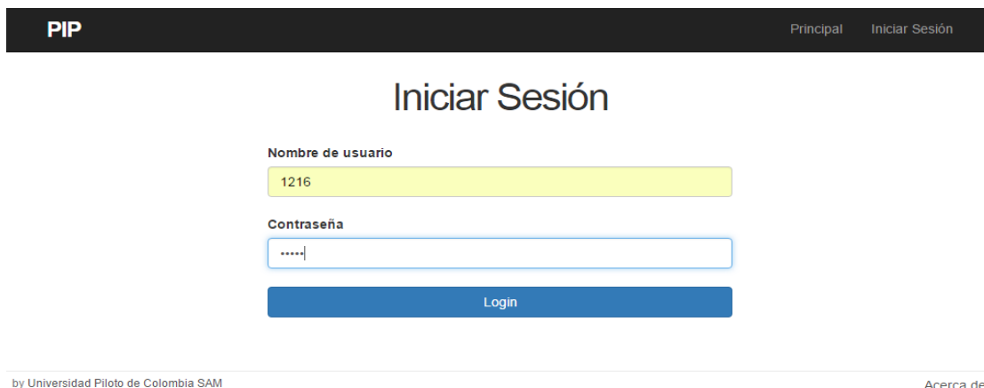
Ilustración 3: Interfaz Iniciar Sesión - Consultor PIP.

Como se puede visualizar en la parte superior derecha en la se encuentra el hipervínculo "Iniciar sesión" del aplicativo donde todo integrante de la comunidad académica piloto que posea usuario y contraseña institucional actualizada y vigente podrá realizar login sin ningún problema.