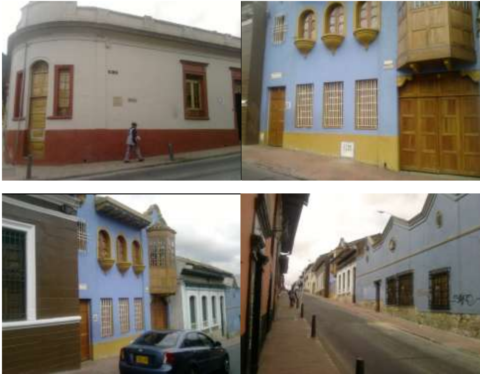
Fundación Proyecto de Vida