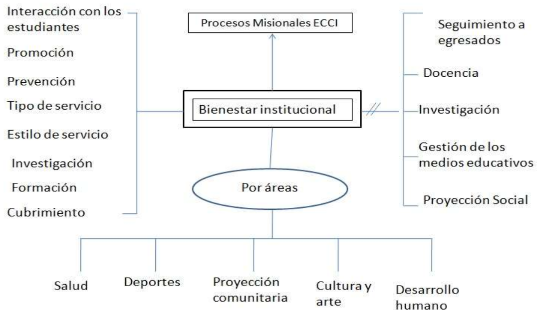
Grafico 1. Mentefacto de bienestar institucional.

El mentefacto conceptual aporta un concepto más amplio de la dinámica que genera y se genera en esta área: