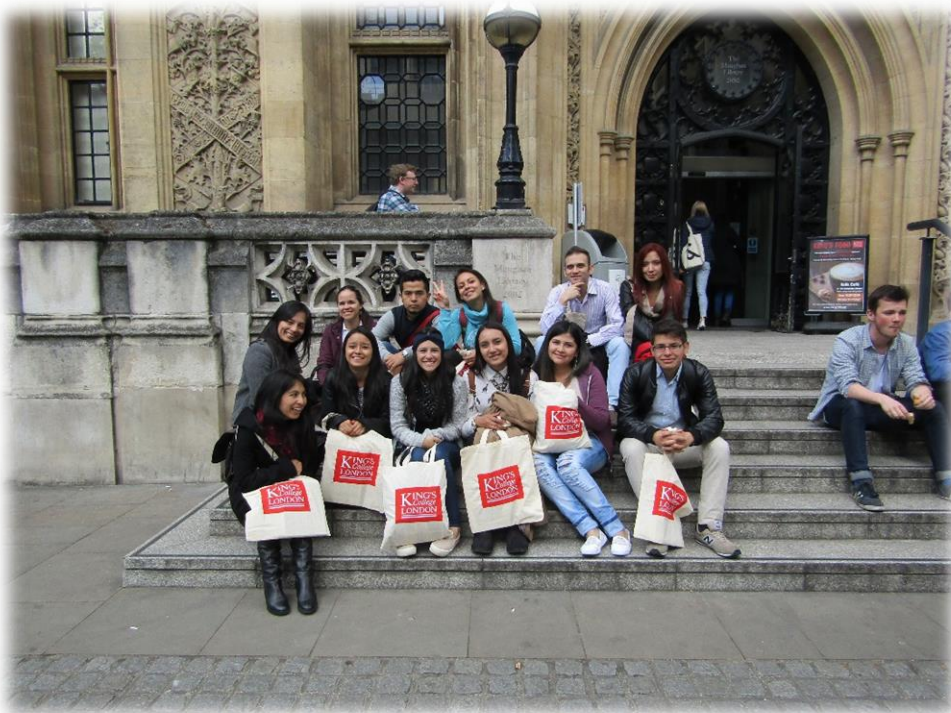
King's College of London