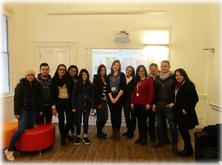
English Gallery School