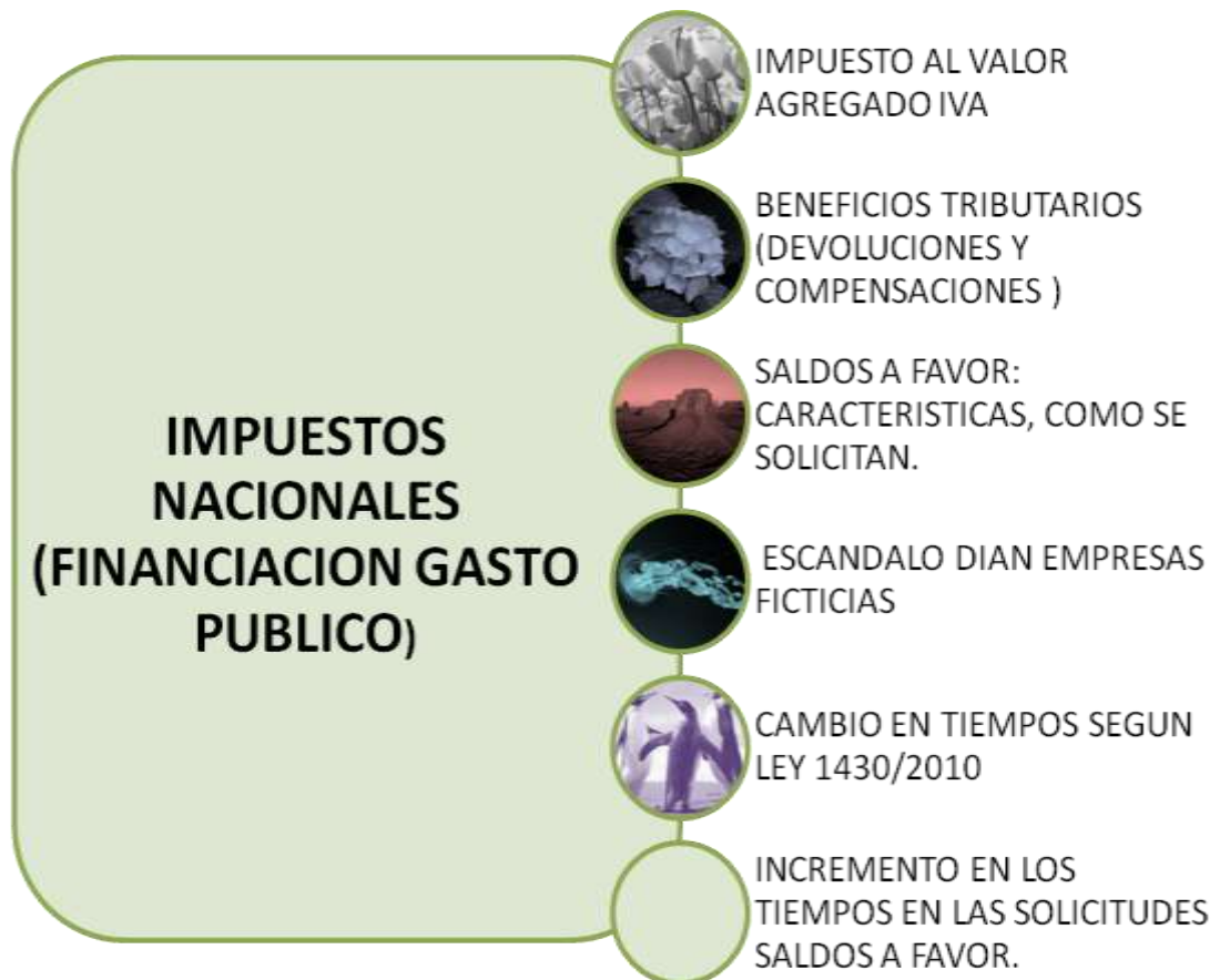
Figura 2. Análisis impuesto al valor agregado

FUENTES: CASTAÑEDA. Aleyda, BECERRA. Pilar, conclusiones 2012