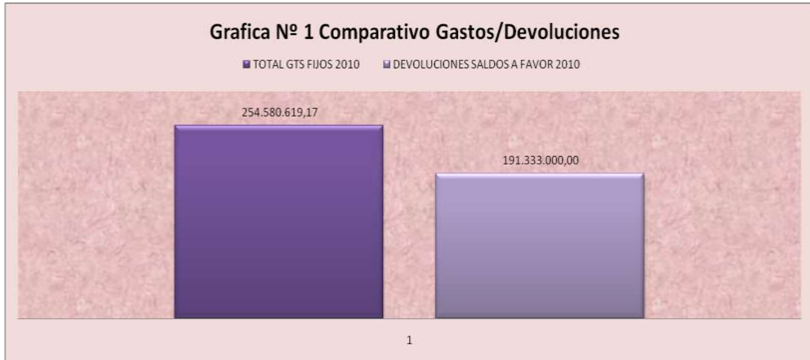
Gráfica 1. Comparativo gastos/ devoluciones

Fuente: CASTAÑEDA. Aleyda, BECERRA. Pilar, conclusiones 2010