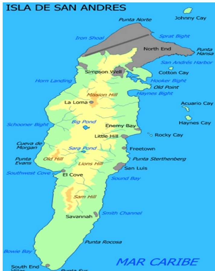
Figura 1. Ubicación Comunidad de San Luis