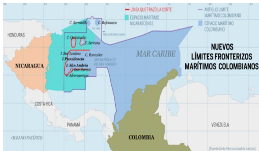
Figura 2. Perdida del territorio marítimo