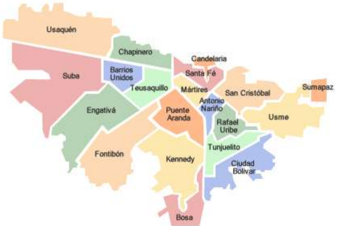
Figura No. 1. División administrativa de Bogotá, DC.